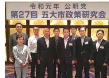
令和元年 公明党 第27回 五大市政政策研究会