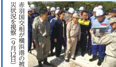
赤羽国交相が横浜港の被災状況を視察(9月12日)